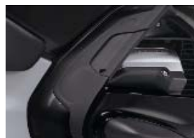
Appuis pour genoux