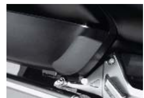
Moules de protection coffres