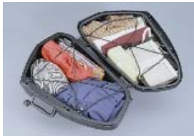
Courroies de coffre