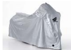
Bâche pour moto "Outdoor"