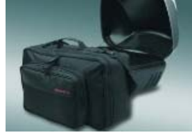
Sac pour top box