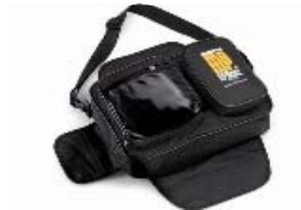
Sac réservoir magnétique