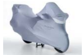
Bâche pour moto "Indoor"