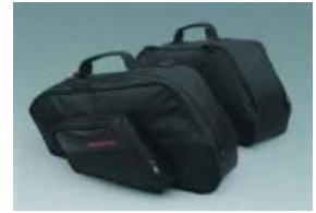
Sacs pour coffres latéraux